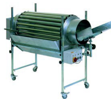
A 357 B – A 3512 B