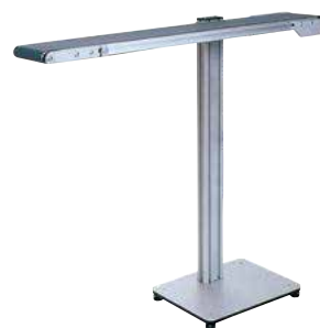
MTF I-Tech Typ IL