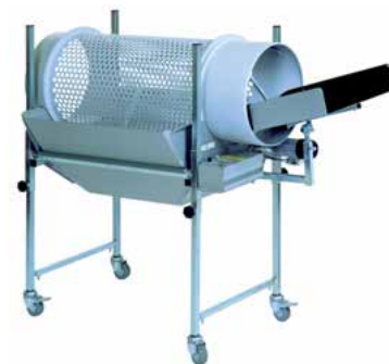
SEPARATOR 307 B