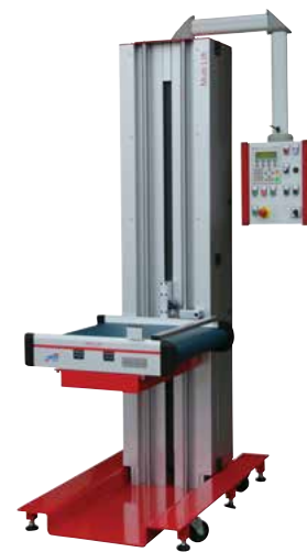
MTF Multi-Tech Lift ML 500-500 | ML 1.000-500