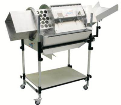
gecombineerde rechthoek/ gatentrommel