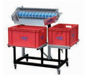
MSL 800 met box-support