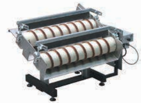
MSR 600 met dubbele schroef voor spuitgietproducten