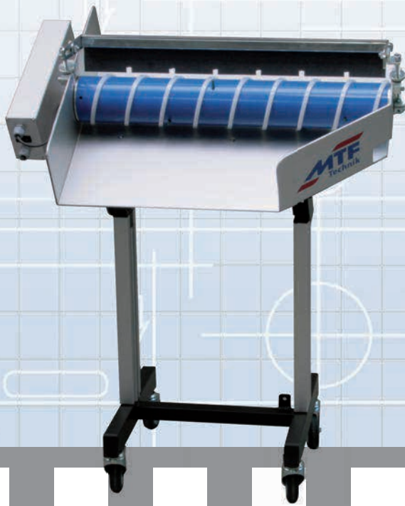
MTF Multi-Separator MSL-600