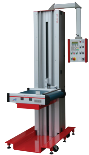
MTF Multi-Lift ML 500-500 | ML 1.000-500