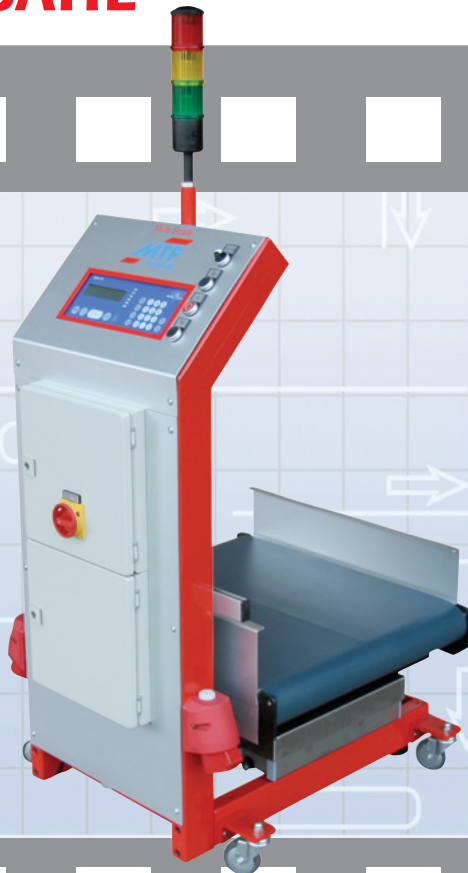
MTF Multi-Scale WT 0-60/20