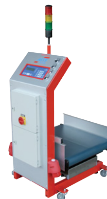
MTF Multi-Scale WT 0-60/20